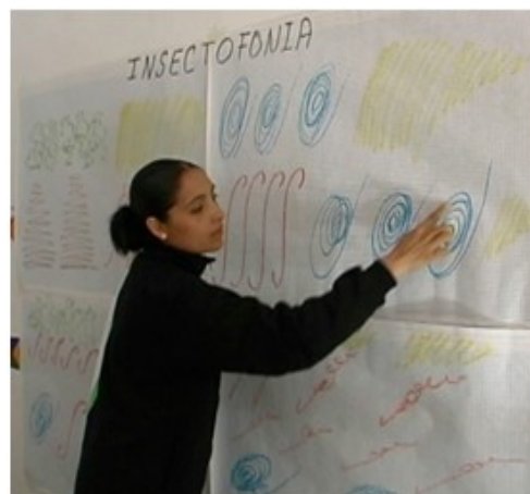
Figura 7. Las grafías se utilizaron para contar un cuento musical.

Se solicitó a los niños que fabricaran un instrumento cuyo sonido fuera similar al producido por el insecto de su preferencia. Esta actividad no solo puso a prueba sus inteligencias para